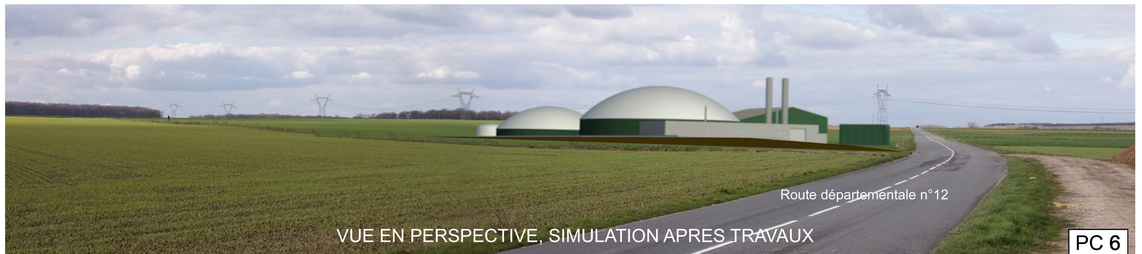
VUE EN PERSPECTIVE, SIMULATION APRES TRAVAUX