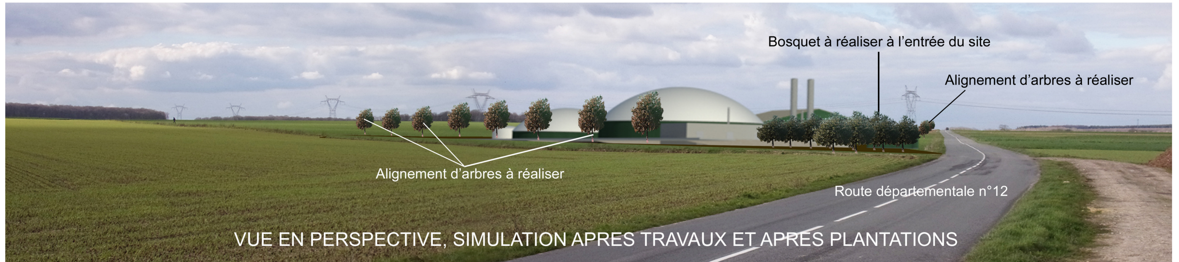
VUE EN PERSPECTIVE, SIMULATION APRES TRAVAUX ET APRES PLANTATIONS

Jean-François RÉTHORÉ ARCHITECTE D.P.L.G. 16 Ter Chemin des Vendangeurs 49570 - MONTJEAN S/LOIRE Tél. 02 41 78 15 72 - Fax. 02 41 22 96 61